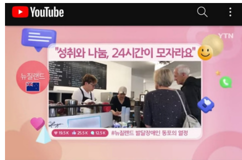
"성취와 나눔, 24시간이 모자라요"...뉴질랜드 발달장애인 동포의 열정 [글로벌코리안] / YTN korean 조회수 498회 · 4일 전 #발달장애 #뉴질랜드 #한인 ...더보기